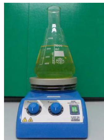
VIGORAMIN®N8 diluito in soluzione di impiego