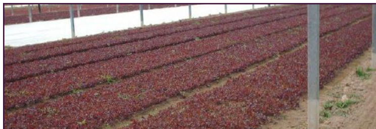
Coltura di IV gamma in serra fertilizzata con OROSOIL®

OROSOIL® è consigliato per terreni di cui si deve rivitalizzare l'attività biologica: