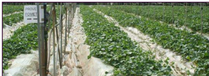
Coltura di melone in tunnel fertilizzata con OROSOIL®

Importante aspetto distintivo è la completa esclusione dell'utilizzo di matrici organiche risalenti alle tipologie dei fanghi (industriali, da depuratori civili), dei rifiuti (RSU), di sfalci o potature di strade.